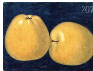
Dr. Seeligs Orangenpepping